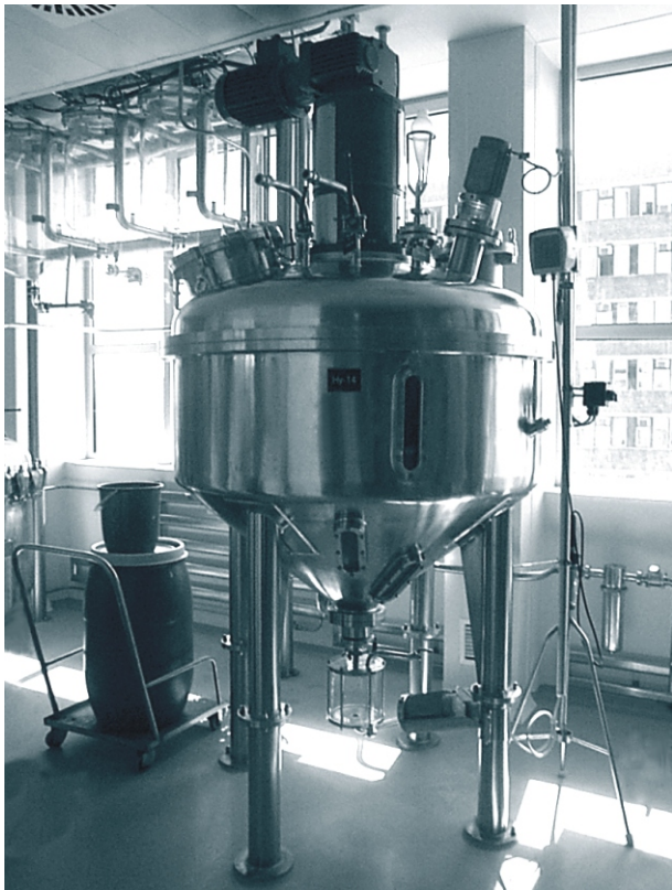
CTK-ES1000 Kúpos extraktor